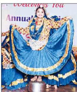
भिवानी। आयोजित कार्यक्रम में अपनी प्रस्तुति देती एक प्रतिभागी व कार्यक्रम में समापन अवसर पर सम्मानित करते हुए।