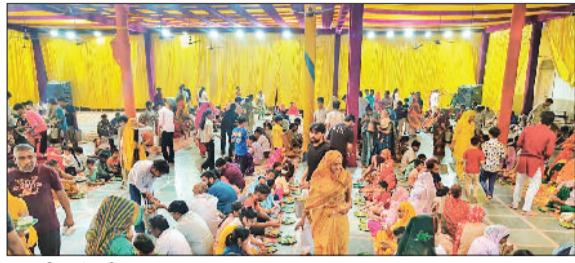
भिवानी। जोहड़ीवाला हनुमान मंदिर।

भगवान श्रीराम के परमभक्त अंजनीपुत्र हनुमानजी कलयुग के जागृत देवता: महंत चरणदास