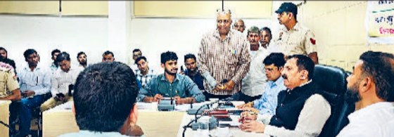
चरखी दादरी। समाधान शिविर में समस्या सुनते उपायुक्त।