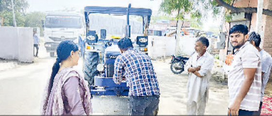
तोशाम। ट्रैक्टर की नंबर प्लेट का फोटो लेते हुए।