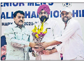
भिवानी। टीम को सम्मानित करते हुए।

कड़ी मेहनत और खेल के प्रति उनके समर्पण को दर्शाता है। खेल विशेषज्ञों का मानना है कि हरियाणा की यह युवा टीम आने वाले समय में राष्ट्रीय स्तर पर नंबर वन बनने की पूरी क्षमता रखती है।