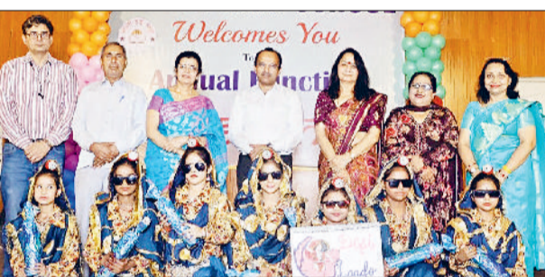
भिवानी। आयोजित कार्यक्रम में अपनी प्रस्तुति देती एक प्रतिभागी व कार्यक्रम में समापन अवसर पर सम्मानित करते हुए।

ही हमारी ताकत हैं क्योंकि वे कभी इतने सालों से स्कूल का सहयोग कर रहे हैं। साथ ही, उन्होंने परेंट्स को आश्वासन भी दिया कि अब से हर वर्ष एनुअल फंक्शन किया जाएगा और बच्चों में छुपी विभिन्न प्रतिभाओं को उभारने के लिए एक