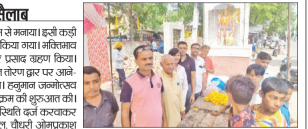
भिवानी। भगवान हनुमानजी को नमन करते श्रद्धालु।