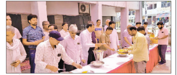
भिवानी। भंडारे में श्रद्धालुओं को प्रसाद वितरित करते मार्केट के सदस्य।