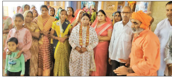
भिवानी। हीरापुरी मंदिर में पूजन करते श्रद्धालु।